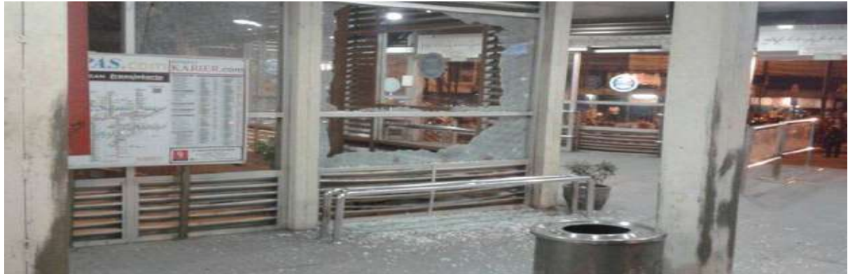
Gambar 2.17. Ledakan di Kampung Melayu, Jakarta

lainnya adalah polisi yang sedang berdinamika mengamankan pawai obor menyambut bulan Ramadhan (Fitriyani, 2017).