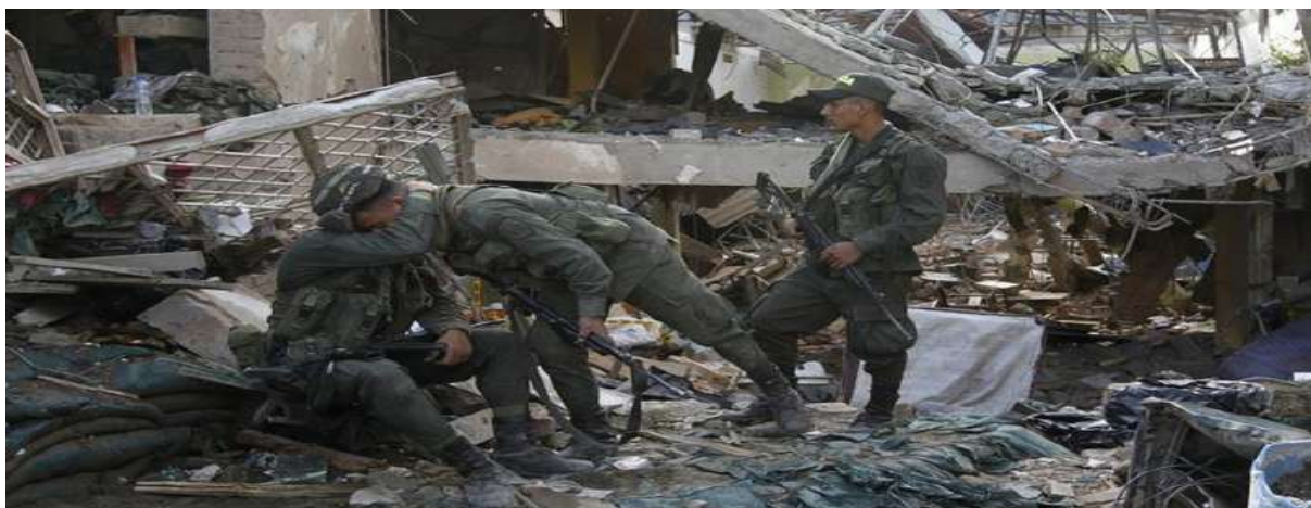
Gambar 3.12. Ledakan Bom FARC

Kelompok FARC juga kerap melakukan pengeboman dengan tujuan untuk menimbulkan kepanikan dan kekacauan di tengah masyarakat. Metode yang sering mereka gunakan adalah dengan meletakkan bom pada kerumunan atau menggunakan bom mobil yang mengakibatkan orang di sekitar kejadian akan tewas atau mengalami luka parah. Salah satu pengeboman yang dilakukan oleh FARC adalah pengeboman gereja. FARC terus berkembang dengan uang yang dimiliki melalui penjualan narkoba dan menguasai sekitar 1/3 wilayah dari negara Kolombia.