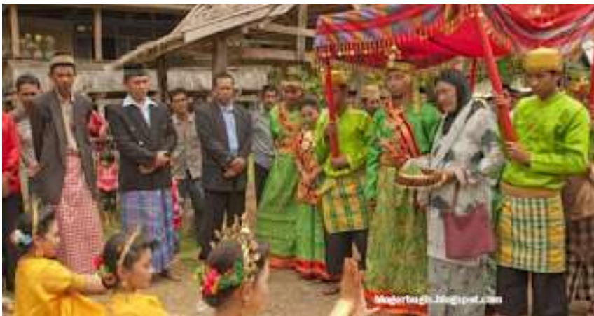
Gambar 5.14. Madduppa Botting

Selanjutnya acara madduppa botting (menyambut kedatangan pengantin), berarti menyambut kedatangan mempelai pria di rumah mempelai wanita. Acara penyambutan tersebut dilakukan oleh beberapa orang yaitu dua orang paddupa atau penyambut (satu remaja pria dan satu wanita remaja), dua orang pakkusu-kusu (perempuan yang sudah menikah), dua orang pallipa sabbé (pria dan wanita berumur sekitar 30 sampai 40 tahun), seorang wanita pangampo wenna (penebar beras), serta satu atau dua orang paddupa botting yang bertugas menjemput dan menuntun mempelai pria turun dari mobil menuju ke dalam rumah. Sementara itu, seluruh rombongan mempelai pria dipersilakan duduk pada tempat yang telah disediakan untuk menyaksikan pelaksanaan acara akad nikah.