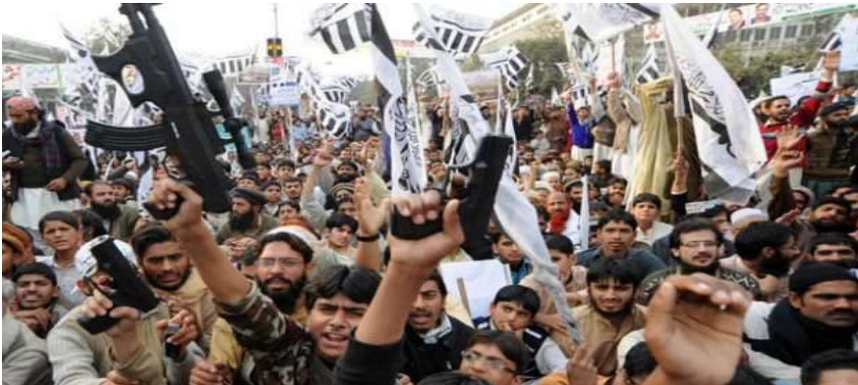
Gambar 3.5. Lashkar-e-Taiba di Pakistan

Lashkar-e-Taiba atau Army of the Pure atau dikenal juga sebagai Jama'atud Dakwah merupakan sekutu dekat kelompok jihadis global Al-Qaidah dan Taliban. Hafidz Saeed sebagai pemimpin LeT yang telah menjalani tahanan rumah lalu dibebaskan oleh Pemerintah Pakistan setelah Pengadilan Tinggi Lahore mempertimbangkan bahwa pembebasannya tidak akan berdampak pada masalah finansial maupun diplomatik bagi negaranya. Amerika Serikat memasukkan Saeed ke dalam blacklist penetapan khusus teroris global dan juga semua lembaga amal nya masuk kedalam daftar organisasi teroris asing. Amerika Serikat juga menyediakan hadiah uang senilai US$ 10 juta bagi setiap informasi untuk menangkap dan menahan Saeed. Pengadilan Tinggi Lahore memutuskan untuk membebaskan Saeed satu pekan setelah Kongres Amerika Serikat melalui Undang-Undang Otorisasi Pertahanan Nasional telah menghapus syarat bagi Pakistan untuk mengambil tindakan terhadap LeT agar aliran uang dari anggaran pendukung koalisi bisa cair untuk Islamabad. Pembebasan Said ini diprotes oleh pemerintah India. India menganggap Pakistan mendukung gerakan teroris (Muslim, 2017).