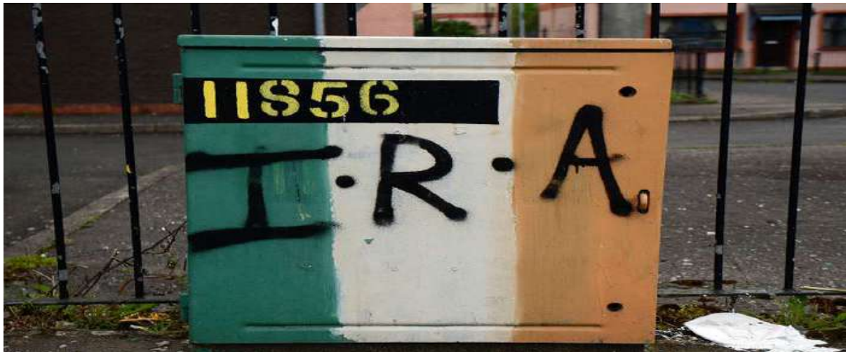
Gambar 3.20. Lukisan spray-painted IRA di Irlandia Utara