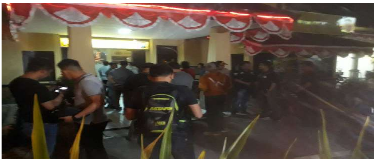
Gambar 2.26. Polsek Wonokromo Surabaya Disterilkan Pasca Penyerangan Anggota Polisi

Peristiwa ketiga yaitu seorang terduga teroris IM menyerang seorang anggota Polsek Wonokromo Surabaya dengan senjata tajam pada tanggal 17 Agustus 2019 dengan berpura-pura ingin membuat laporan. IM yang terpapar radikalisme melakukan aksinya berdasarkan kehendak sendiri. IM berprofesi sebagai penjual sempol dan macaroni memiliki keterkaitan dengan pelaku pengeboman gereja di Surabaya yang terjadi pada tahun 2018. Tindakan IM mengakibatkan anggota polisi yang diserang mengalami luka parah di bagian kepala dan tangan (Halim & Carina, 2019).