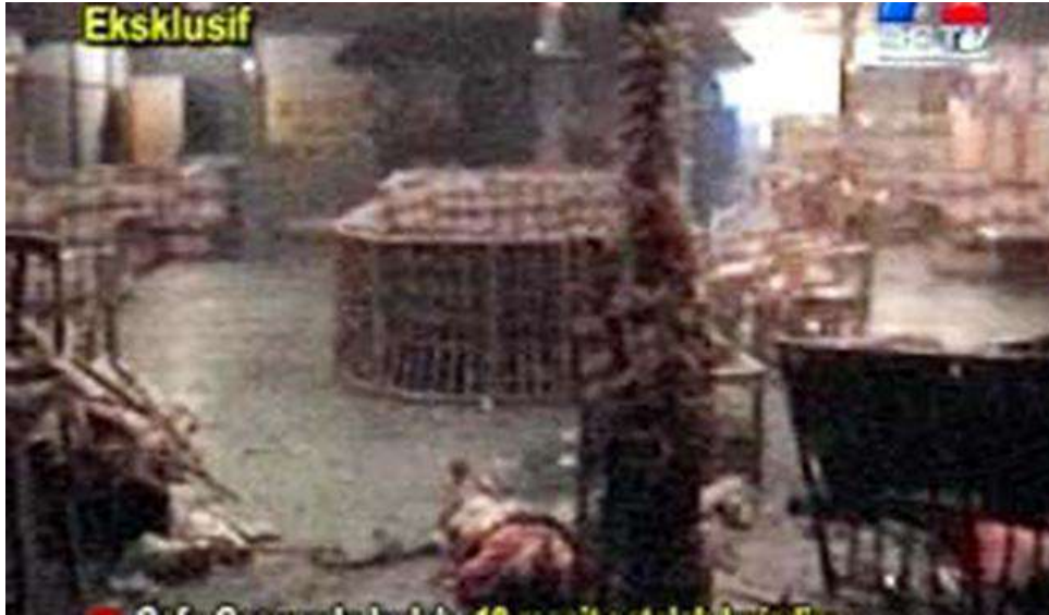
Gambar 2.5. Ledakan Bom di Kafe Sampoddo Indah di Palopo, Kabupaten Luwu, Sulawesi Selatan

yang penting untuk perdagangan sekaligus lokasi wisata. Jarak Kota Palopo sekitar 365 kilometer dari Kota Makassar.