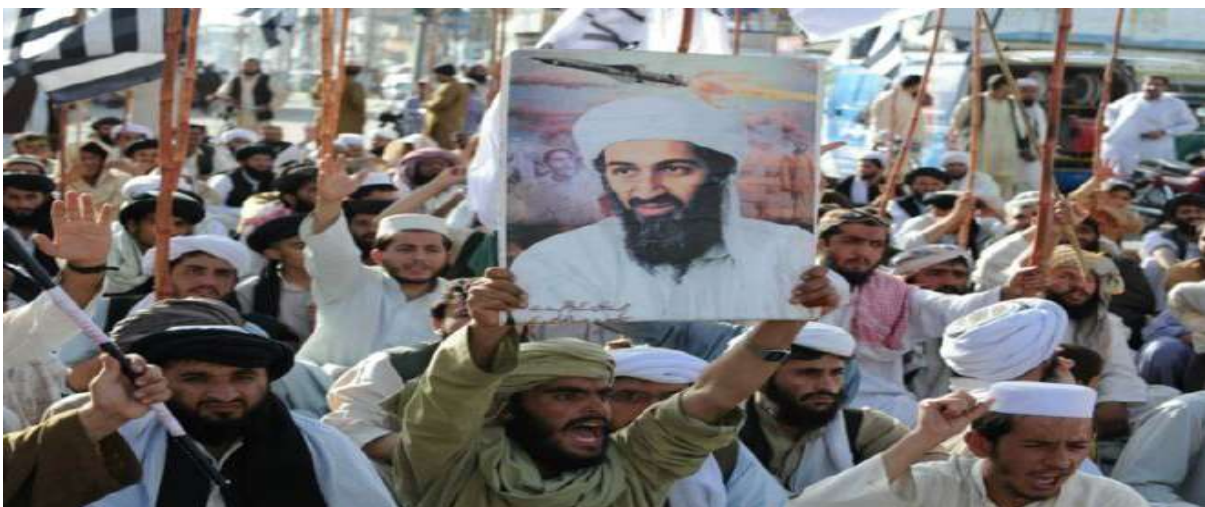
Gambar 3.13. Demonstrasi Anti-Amerika Serikat Berlangsung di Pakistan Tak Lama Setelah Eksekusi Terhadap Bin Laden Tahun 2011

Organisasi ini memiliki pendapatan sebesar US$ 100 juta per tahun atau Rp.1,19 triliun (kurs: Rp.11.995 per dollar AS). Didirikan oleh Osama Bin Ladin, organisasi militan Islam ini telah ada sejak tahun 1980-an. Setelah menyerang beberapa daerah sipil dan militer, Al-Qaeda dikenal di seluruh dunia sebagai salah satu kelompok teroris terbesar dan paling mematikan. Bom bunuh diri adalah salah satu taktik favorit mereka dari kehancuran. Kelompok ini semakin mendunia setelah berhasil meratakan World Trade Centre di New York City. CIA memperkirakan Al-Qaeda memiliki pendapatan lebih dari US$ 30 juta per tahun pada saat itu. Selain itu Bin Ladin adalah seorang multi jutawan saat mendirikan organisasi ini (Praditya, 2014).