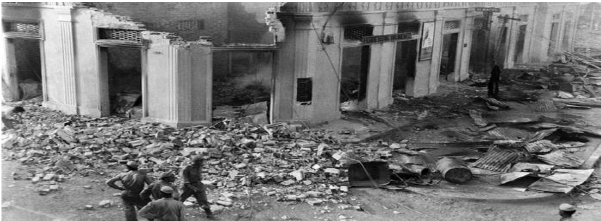
Gambar 3.8. Dampak Perang antara Pemerintah Kolombia dan FARC

Kelompok FARC pada awalnya adalah pihak oposisi dari pemerintah Kolombia saat terjadi perang sipil. Kelompok ini dibiarkan pada saat perdamaian terjadi untuk membuat negara sendiri dengan Republik Marquetalia. Pada akhirnya, pemerintah melarang pendirian negara tersebut yang menyebabkan anggota kelompok ini mengamuk. Kemudian, kelompok ini mengubah nama menjadi FARC dengan beranggotakan 50 orang. Akibat kekerasan, siksaan, dan trauma yang didapatkan dari pemerintah Kolombia menjadikan kelompok tersebut berubah menjadi kelompok teroris yang kejam dan membunuh rakyat Kolombia tanpa rasa perikemanusiaan (Nugroho, 2016).