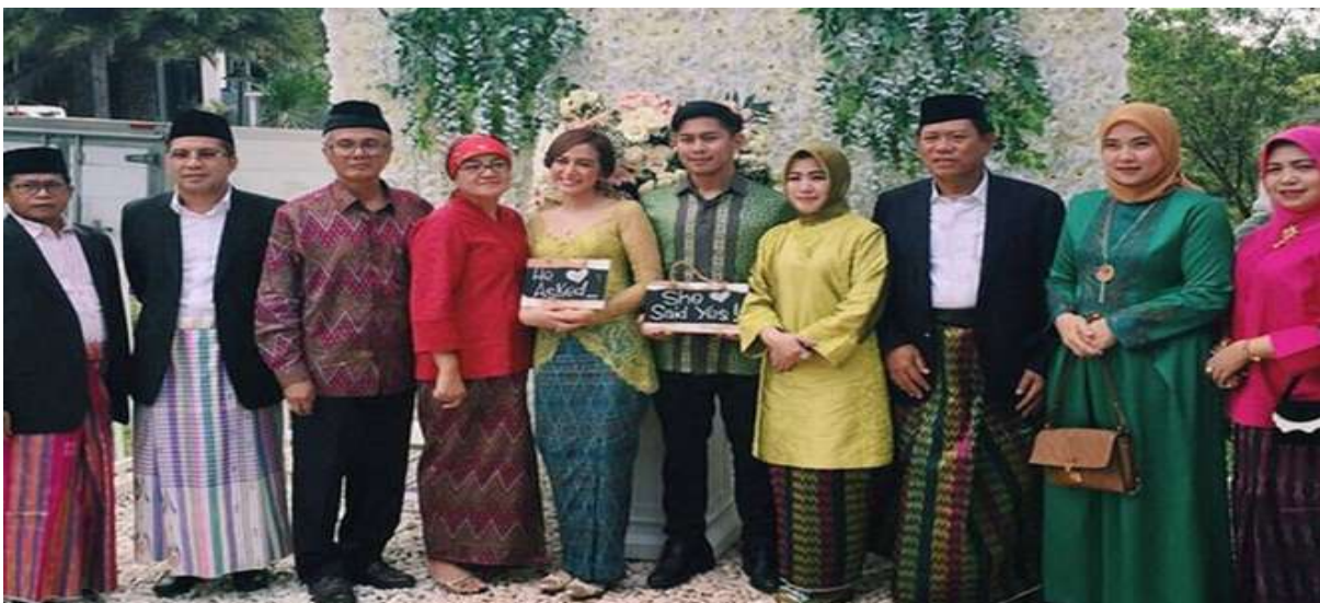
Gambar 5.5. Mappasiarekeng

Dikenal juga istilah mappasiarekeng (mengukuhkan kesepakatan), berarti mengukuhkan kembali kesepakatan-kesepakatan yang telah dibuat sebelumnya. Acara ini dilaksanakan di tempat mempelai perempuan. Pengukuhan kesepakatan ditandai dengan pemberian hadiah pertunangan dari pihak mempelai pria kepada pihak mempelai wanita sebagai passio' atau pengikat berupa sebuah cincin emas dan sejumlah pemberian simbolis lainnya seperti tebu sebagai simbol kebahagiaan, panasa (buah nangka) sebagai simbol minasa (pengharapan), sirih pinang, sokko (nasi ketan), dan berbagai kue-kue tradisional lainnya.