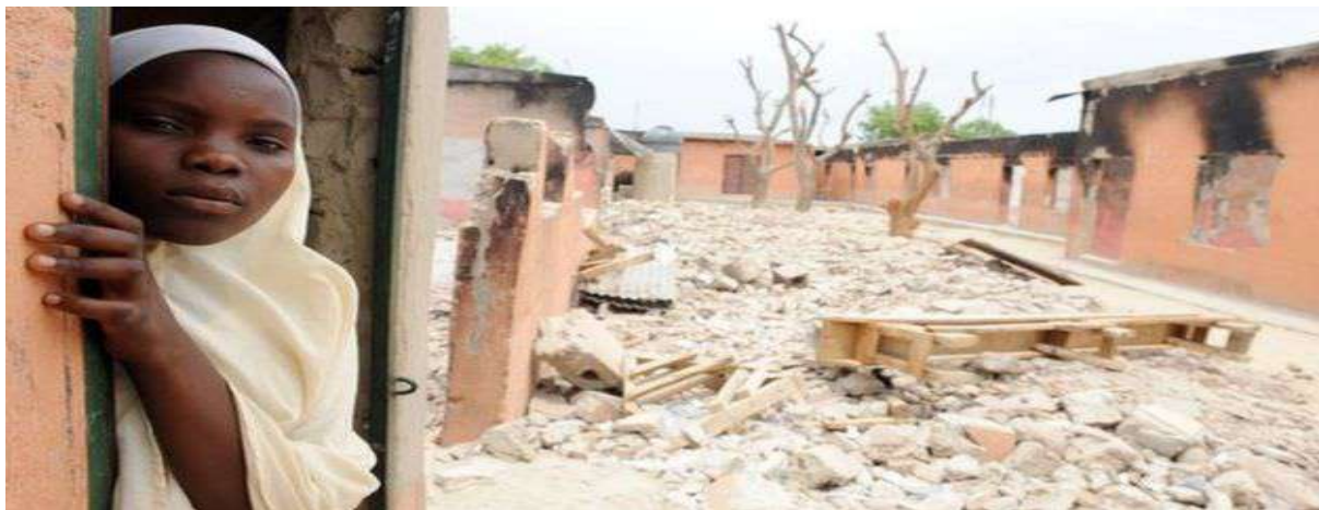
Gambar 3.2. Situasi setelah Penyerangan Boko Haram ke Sekolah di Utara Nigeria

Boko Haram melarang umat Islam untuk aktif dalam kegiatan sosial atau politik yang terkait dengan masyarakat Barat. Hal ini dilakukan karena menurut Boko Haram aktivitas-aktivitas seperti ini adalah haram. Boko Haram juga melarang anggotanya dan masyarakat untuk ikut dalam pemilihan umum, mengenakan kemeja dan celana panjang atau menerima pendidikan sekular atau pendidikan Barat. Boko Haram menganggap Nigeria telah diperintah oleh orang-orang yang tidak beriman sekalipun presidennya adalah seorang Muslim. Kejahatan Boko Haram ini bukan hanya terjadi di Nigeria tetapi juga di negara-negara tetangga Nigeria (BBCNews, 2016).