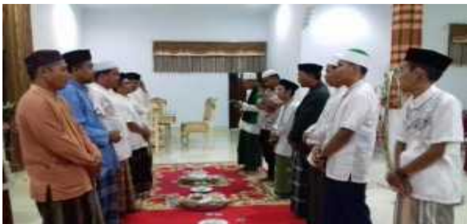
Gambar 5.3. Tradisi Barazanji

Terdapat nilai keagamaan dalam tradisi mappatettong bola . Sebelum melakukan proses mappatettong bola , terlebih dahulu diadakan barazanji . Barazanji adalah kegiatan yang dilakukan dengan mengucapkan doa-doa serta pujian kepada Nabi Muhammad SAW. Doa-doa ini dilafalkan dengan nada atau irama tertentu. Barazanji dilakukan dalam beberapa tradisi suku Bugis, salah satunya dalam proses mappatettong bola . Hal ini bertujuan sebagai wujud rasa syukur kepada Allah SWT dan shalawat kepada nabi Muhammad SAW. Selain itu, juga sebagai wujud memohon keberkahan dan keselamatan atas rumah baru yang akan ditinggali itu.