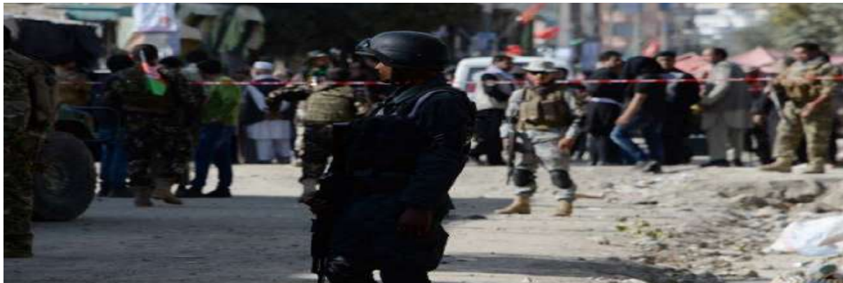
Gambar 3.17. Serangan Milisi Taliban di Markas Keamanan Afghanistan

Serangan Taliban yang terjadi di kantor polisi di kota Firozkoh pada tanggal 29 Mei 2019 seperti pada gambar di atas menyebabkan 16 warga sipil dan lima polisi tewas sejumlah militan Taliban. Milisi Taliban menyerang kantor polisi di distrik Dawlat Abad di Provinsi Baikh, Utara Afghanistan pada tanggal 6 Maret 2019 dan menyebabkan delapan petugas keamanan tewas serta melukai tujuh petugas keamanan dan banyak anggota Taliban terbunuh (Suaracom, 2019).