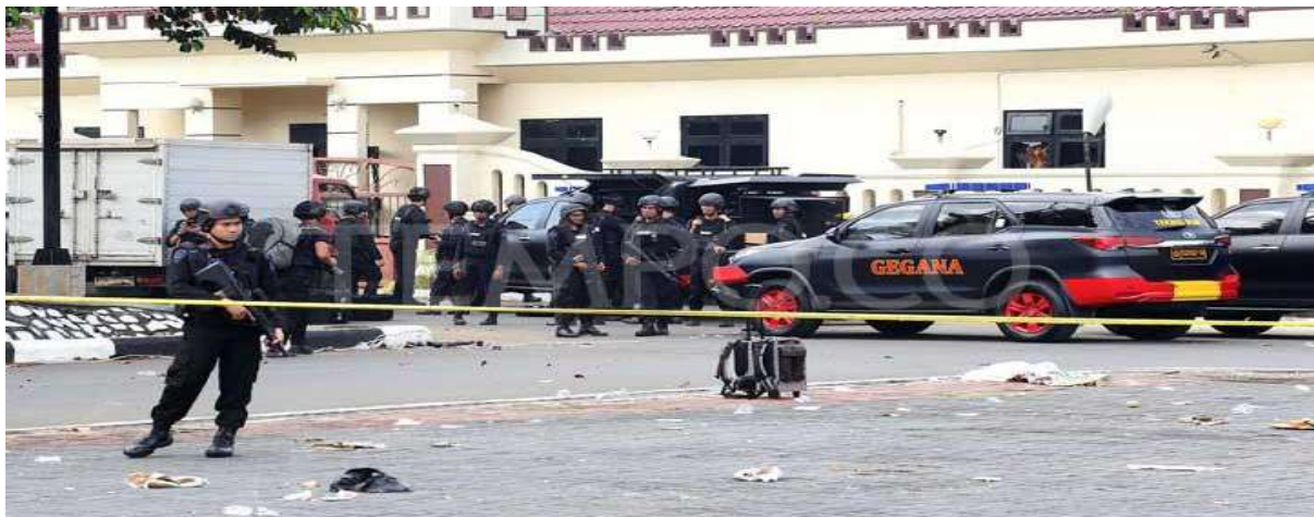
Gambar 2.20. Pasca Kerusuhan di Sel Teroris Mako Brimob

Kerusuhan terjadi di Markas Komando (Mako) Brimob, Kelapa Dua, Depok, Jawa Barat pada bulan Mei 2018. Kerusakan ini terjadi akibat para narapidana terorisme mengebol sel tahanan dan adu fisik dengan polisi yang sedang berjaga. Kejadian ini menyebabkan lima anggota kepolisian dan satu napi meninggal dunia. Menurut keterangan pihak kepolisian, insiden ini berawal dari titipan makanan dari keluarga yang masih dipegang oleh petugas. Hingga akhirnya salah satu narapidana tak terima dan mengajak rekan-rekannya untuk membuat kerusuhan (Akbar, 2018).