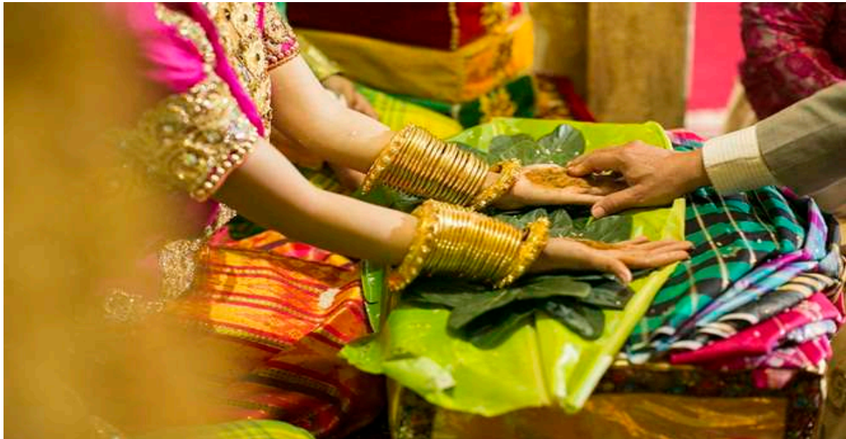
Gambar 5.8. Mappassau Botting

10.00 pagi. Setelah mandi tolak bala, mempelai wanita harus melaksanakan ritual macceko yaitu mencukur bulu-bulu halus yang ada didahi calon pengantin dan biasanya dilakukan oleh indo' botting (perias penganti).