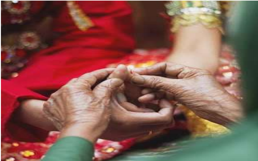
Gambar 5.15. Mappasikarawa

Dilanjutkan dengan kegiatan tudangbotting . Setelah perkawinan berlangsung, biasanya diadakan acara resepsi (walimah) dimana semua tamu undangan hadir untuk memberikan doa restu dan sekaligus menjadi saksi atas pernikahan kedua mempelai agar mereka tidak berburuk sangka ketika suatu saat melihat kedua mempelai bernesraan. Pada acara resepsi tersebut dikenal juga yang namanya ana botting yang mempunyai andil sehingga merupakan sesuatu yang tidak terpisahkan pada masyarakat Bugis. Selain itu, dalam setiap perkawinan kedua mempelai diapit oleh balibotting dan passepik yang bertugas untuk mendampingi pengantin di pelaminan.