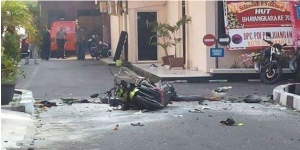
Gambar 2.14. Ledakan Bom Bunuh Diri di Mapolresta Solo