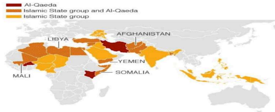
Gambar 3.14. Kelompok Al-Qaeda dan ISIS di Dunia

brutal”(Ali, 2019). Al-Qaeda meningkatkan serangan melalui sejumlah cabang dan kolega mereka secara stabil. Mereka melancarkan 316 serangan di seluruh dunia selama tahun 2018 (Ali, 2019).