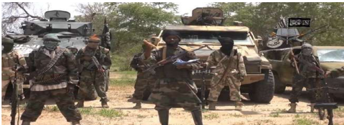
Gambar 3.1. Boko Haram dan Abubakar Shekau (tengah)

Organisasi ini memiliki pendapatan sebesar US$ 70 juta per tahun atau Rp.839,6 miliar (kurs: Rp.11.995 per dollar AS). Boko Haram adalah kelompok teroris Nigeria yang berjuang menggulingkan pemerintah Nigeria untuk menciptakan negara Islam. Mereka telah membom markas PBB dan telah menculik lebih dari 200 gadis sekolah Nigeria. Dari aksi penculikan tersebut tidak jelas berapa banyak uang yang mereka dapatkan dari uang tebusan. Telah dilaporkan antara 2006-2011, mereka mengumpulkan lebih dari US$ 70 juta (Praditya, 2014).