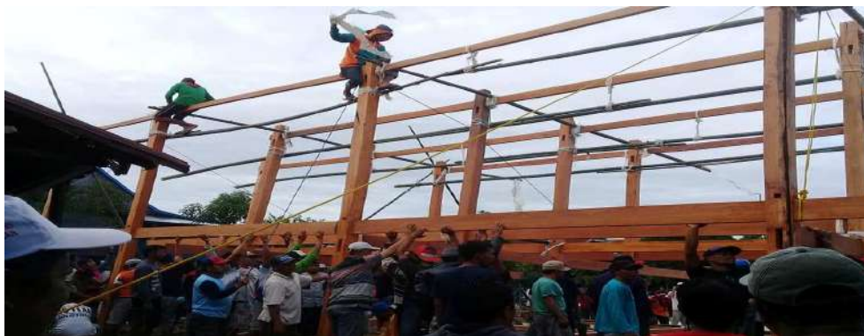
Gambar 5.1. Kegiatan Mappatettong Bola

Masyarakat suku bugis mengenal enam peristiwa sakral dalam hidup, yaitu Esso rijangna ( the day of her birth ), Esso ripasellenna ( Islamic Day ), Esso ripallebbana ( Qur'an Day ), Esso ripabbolana ( the day of House Construction ), Esso ripahajjinna ( the day of pilgrimage ), dan Esso rimatena ( the day of his death ). Tradisi mappatettong bola ( construct the house ) merupakan peristiwa sakral dalam masyarakat bugis, yaitu Esso ripabbolana ( the day of House Construction ). Mappatettong bola ( construct the house ) menjadi budaya gotong-royong karena masyarakat secara bersama-sama membantu mendirikan kerangka rumah baru atau memindahkan rumah lama ke tempat baru dengan cara diangkat (Kesuma & Rahman, 2018). Kegiatan Mappatettong bola ( construct the house ) dapat dilihat pada gambar berikut: