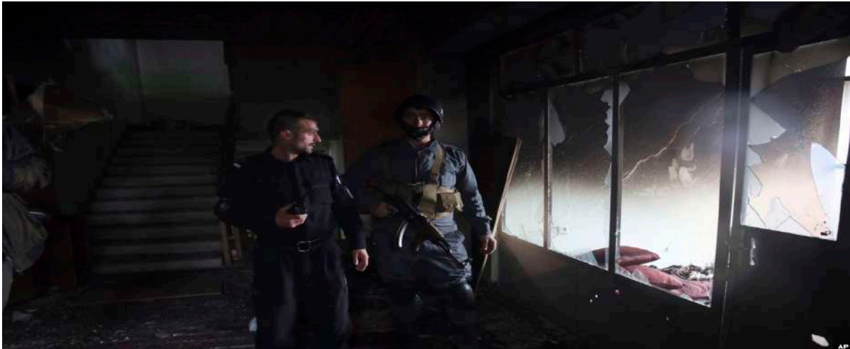
Gambar 3.21. Personel Keamanan Afghanistan Memeriksa Rumah Ibadah Sikh Pasca Serangan di Kabul, Afghanistan

Pemahaman yang salah dalam menerjemahkan nilai-nilai agama khususnya jihad menjadikan orang atau sekelompok orang memiliki pemahaman yang sempit tentang nilai-nilai agama tersebut sehingga mereka mudah untuk mendukung atau terlibat dalam melakukan aksi teror. Selain itu, contoh diatas juga memberikan gambaran mengenai peran faktor internasional dalam memberikan dukungan logistik baik dalam bentuk pendanaan maupun persenjataan sebagai salah satu bentuk ikatan emosional yang kuat antara jaringan lokal dengan internasional juga menjadi salah satu pemicu keterlibatan orang dalam kegiatan terorisme.