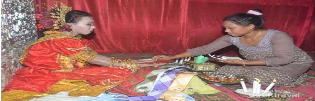
Gambar 5.12. Tradisi Mappacci

Pacci dalam kata bahasa Bugis berarti bersih atau suci sedangkan tudampenni secara harfiah berarti duduk malam. Dengan demikian, mappacci berarti mensucikan diri pada malam menjelang hari “H” perkawinan.