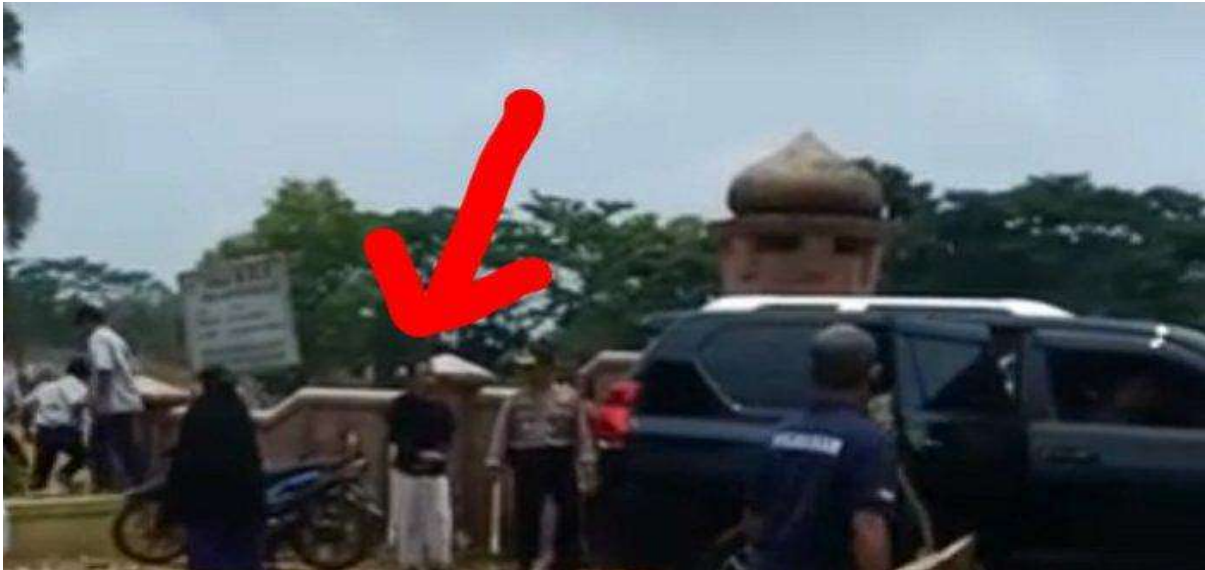
Gambar 2.28. Posisi Pelaku Sebelum Aksi Penusukan Terjadi di Alun-Alun Menes