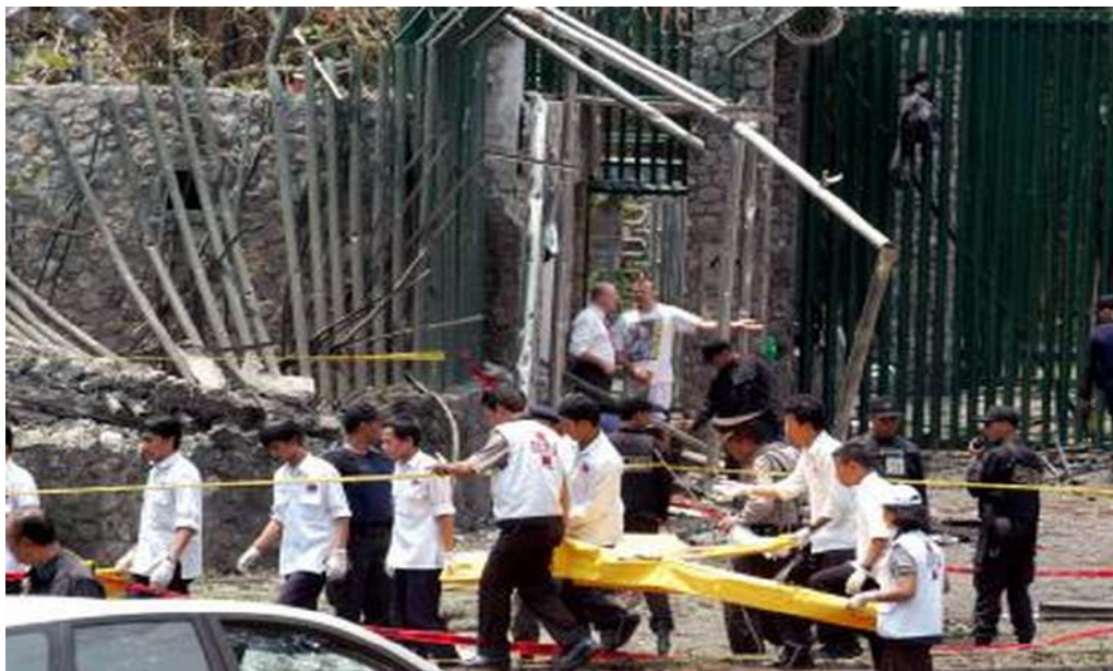
Gambar 2.6. Titik Ledak di Depan Gedung Kedutaan Besar Australia di Kuningan, Jakarta Selatan