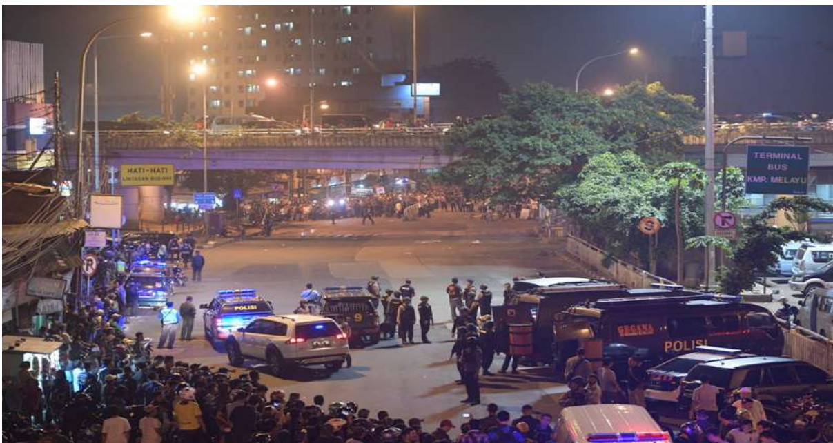
Gambar 2.16. Lokasi Ledakan Bom di Kampung Melayu, Jakarta Timur