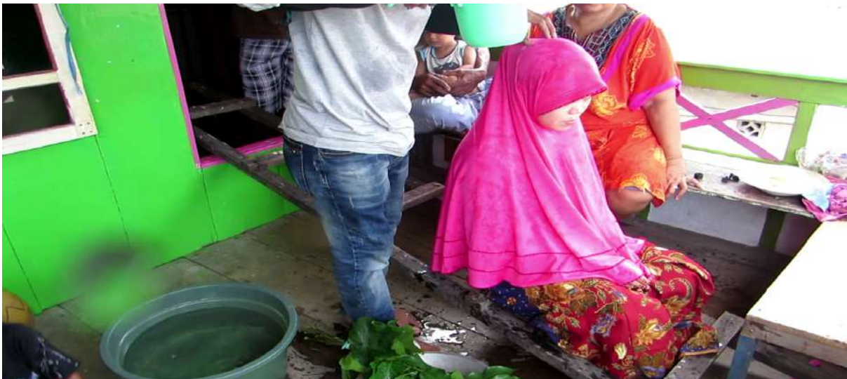
Gambar 5.7. Cemmé Passili'

Tahap berikutnya adalah mappassau botting dan cemme passili (merawat dan memandikan pengantin). Mappassau botting berarti merawat pengantin. Kegiatan ini dilakukan dalam satu ruangan tertentu selama tiga hari berturut-turut sebelum hari “H” perkawinan. Perawatan ini dilakukan dengan menggunakan berbagai ramuan seperti daun sukun, daun coppeng (sejenis anggur), daun pandan, rempah-rempah, dan akar-akaran yang berbau harum.