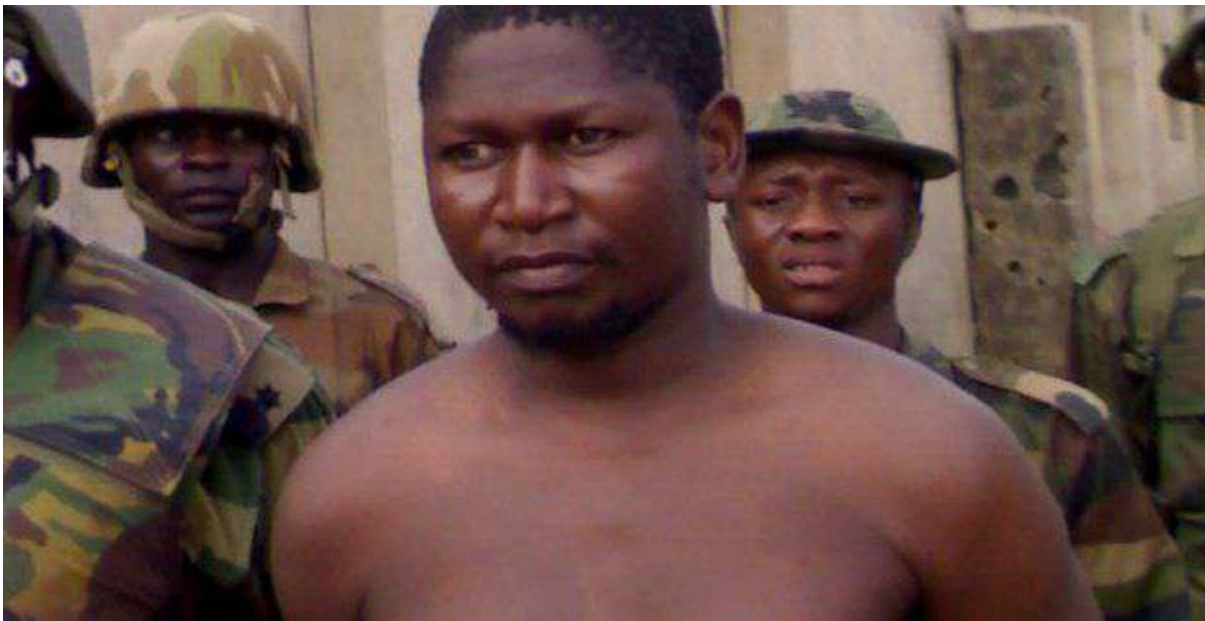
Gambar 3.4. Pendiri Boko Haram Mohammed Yusuf

Boko Haram dibentuk oleh seorang Muslim yang bernama Mohammed Yusuf di Maiduguri pada tahun 2002. Ia mendirikan sebuah kompleks keagamaan yang terdiri dari masjid dan sekolah Islam. Pada awal berdirinya, sekolah Islam tersebut sukses menarik minat keluarga Muslim yang ada di Nigeria dan negara-negara tetangga Nigeria. Seiring berjalannya waktu, Boko Haram tidak hanya aktif dibidang pendidikan tetapi juga aktif dibidang politik dan memiliki cita-cita untuk mendirikan negara Islam. Sekolah Islam yang didirikannya dijadikan sebagai tempat untuk merekrut anggota yang sepaham dengan kelompok Boko Haram (BBCNews, 2016).