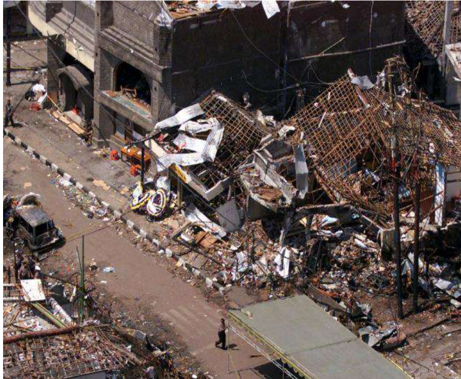
Gambar 2.2. Bom Bali 2002

tersebut tidak memakan korban jiwa. Meski begitu, daun pintu besi kantor Konjen Filipina dikabarkan terlempar sekitar empat meter dari tempatnya (Haryanti & Sartika, 2019).