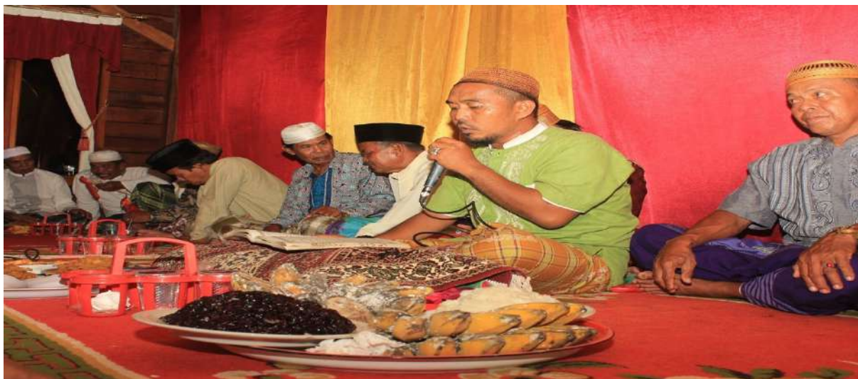
Gambar 5.10. Tradisi Barazanji Menjelang Hari Pernikahan

Seperti yang telah dijelaskan pada paragraf diatas, bahwa dalam masyarakat etnis Bugis, teks barazanji dibaca secara bergantian dengan menggunakan bahasa Bugis atau bahasa Arab. Masyarakat yang hadir duduk bersila dan membentuk lingkaran, di tengahnya di simpan aneka macam olahan makanan khas Bugis. Untuk mengawalinya, ustadz atau yang dituakan akan membaca surat al-Fatihah secara bersama-sama. Kemudian dilanjutkan membaca barazanji secara bergantian dengan suara lantang. Biasanya, yang menjadi peserta barazanji dari kalangan laki-laki. Tradisi ini pada umumnya dilaksanakan satu hari sebelum acara pernikahan dilaksanakan (Firmansyah, 2018).