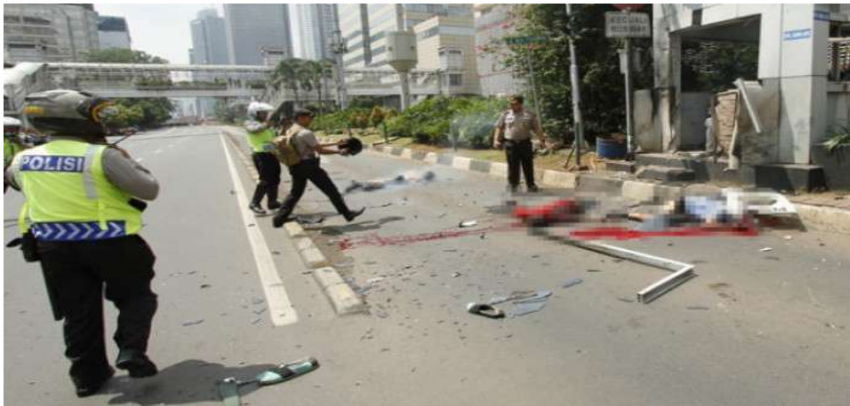
Gambar 2.13. Ledakan Bom Sarinah

dari 114 paku berukuran 5 sentimeter. Jakarta yang awalnya dinyatakan dengan status waspada sejak menjelang tahun baru 2016 berubah menjadi siaga I setelah kejadian pengeboman tersebut. Serangan tersebut meniru tindakan ISIS di enam wilayah Paris pada 13 sampai 14 November 2015 yang menewaskan 150 orang dan 494 orang luka berat dan ringan. Aksi yang dilakukan oleh para pelaku telah direncanakan jauh hari sebelumnya seperti tiga pelaku menyewa kamar kos seluas 3 x 5 meter di tempat yang sama seharga Rp.300 ribu per bulan. Para pelaku juga sudah dilengkapi dengan keterampilan khusus seperti para pelaku menggunakan bom, granat dan senjata rakitan dalam aksinya (Velarosdela & Carina, 2020).