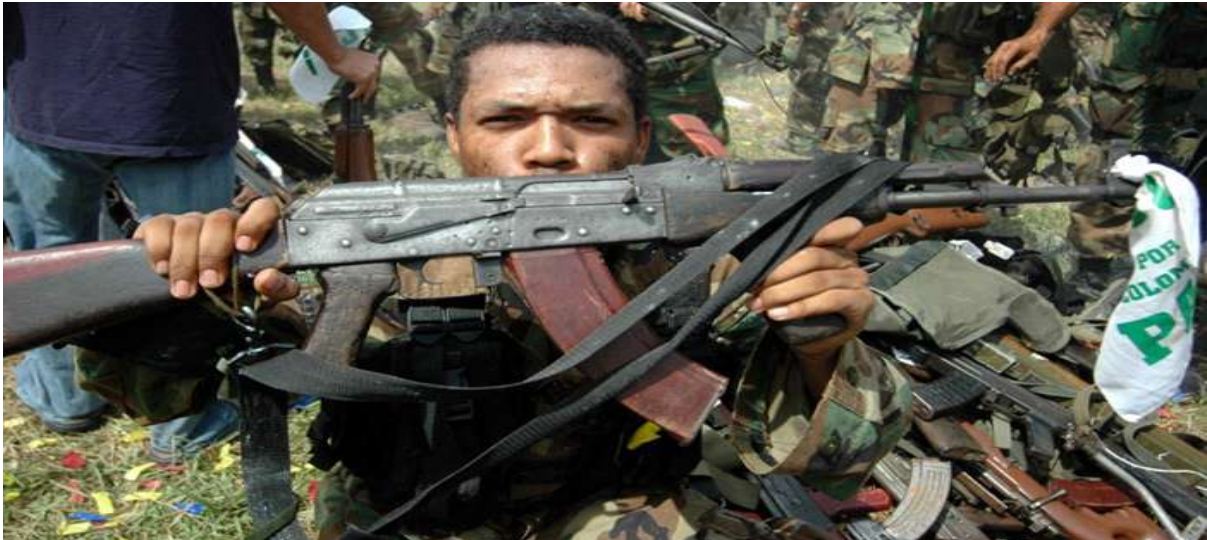
Gambar 3.9. Kelompok AUC

Selain merekrut orang dewasa, FARC juga merekrut anak-anak terutama keluarga menengah ke bawah untuk dijadikan tentara. Kelompok ini mempromosikan kehidupan yang lebih layak dan masa depan yang terjamin bila bergabung dengan kelompok mereka. Anak-anak yang berumur 12 tahun keatas baik laki-laki atau perempuan akan lebih diutamakan dalam proses perekrutan. Anak-anak laki-laki yang berumur 12 sampai 15 tahun akan dilatih setiap hari dalam menggunakan persenjataan. Sementara anak perempuan akan dilatih bagaimana melayani anggota FARC. Setelah berumur 15 tahun, anak-anak tersebut akan diajak ke medan pertempuran (Nugroho, 2016).