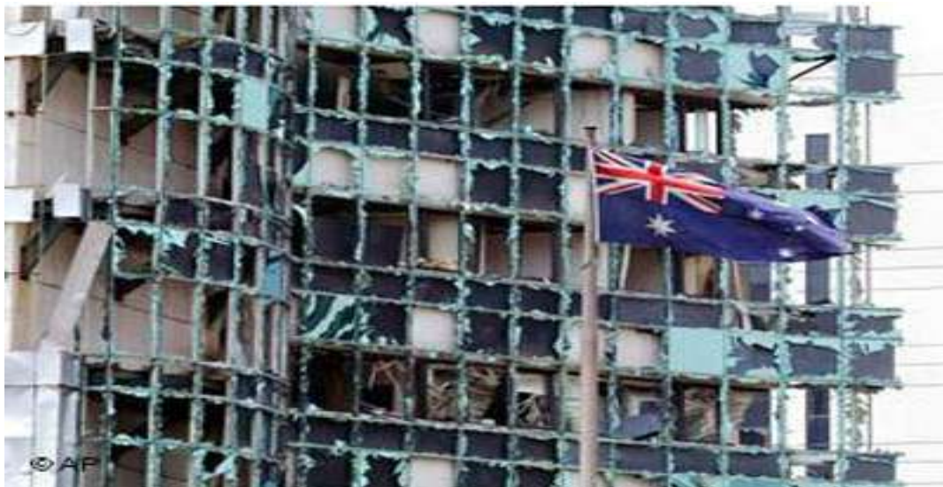
Gambar 2.7. Ledakan Bom Mobil di Depan Kedubes Australia di Jakarta

tinggi tersebut terdengar hingga radius lima kilometer. Ledakan tersebut berasal dari bom mobil Daihatsu Zebra warna putih tahun 1990 dengan boks aluminium di jalur lambat di depan Gedung Kedubes Australia dan tiga meter di depan truk polisi yang sedang melakukan pengamananan di depan Gedung Kedubes. Ledakan tersebut mengakibatkan lubang berdiameter sekitar dua meter dengan kedalaman hampir satu meter. Ledakan tersebut juga merusak pagar besi di depan gedung dan tenda petugas keamanan serta polisi yang berjaga. Gedung-gedung yang berada dengan jarak sekitar 300 meter dari tempat kejadian juga terkena serpihan bom seperti Plaza 89, Kantor Kementerian Urusan Koperasi dan Usaha Kecil Menengah (UKM), Menara Gracia, Graha Binakarsa, Sentra Mulia, dan kantor eks Bank Uppindo. Efek ledakan juga dirasakan sampai di Kawasan Palmerah, Jakarta Pusat dan Warung Buncit, Jakarta Selatan (Haryanti & Wedhaswary, 2019).