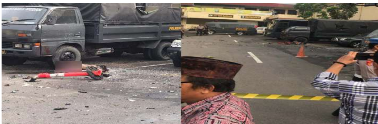
Gambar 2.29. Bom Bunuh Diri di Polrestabes Medan

Pada tanggal 13 November 2019, pelaku yang berinisial RMN yang berusia 24 tahun melakukan bom bunuh diri di Markas Polrestabes Medan, Sumatera Utara. RMN yang tewas saat kejadian telah terpapar radikalisme mengenakan jaket berlogo ojek online dan berstatus sebagai mahasiswa. RMN dibantu kedua temannya untuk membuat bom (Halim & Carina, 2019). Peristiwa tersebut menyebabkan enam orang luka ringan. Empat orang merupakan personel Polri, satu orang pekerja PHL, sementara seorang lain masyarakat biasa. Kejadian ini juga menyebabkan sejumlah kendaraan yang terparkir di dekat TKP mengalami rusak ringan (Yahya & Kuwado, 2019).