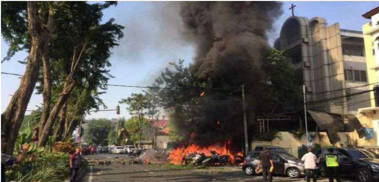
Gambar 2.18. Serangan Bom di Tiga Gereja di Surabaya

Aksi teror bom terjadi di tiga gereja di Surabaya pada tanggal 13 Mei 2018. Ledakan bom terjadi di Gereja Katolik Santa Maria Tak Bercela (STMB), Gereja Kristen Indonesia (GKI) di Jalan Diponegoro Surabaya dan Gereja Pentakosta di Jalan Arjuno Surabaya. Ledakan bom tersebut merenggut korban jiwa hingga delapan orang tewas dan puluhan orang terluka. Bom bunuh diri tersebut diledakkan pada pagi hari menjelang ibadah yang dilakukan oleh para jemaat. Pelaku pengeboman terdiri dari ibu dan dua anak yang tewas seketika di lokasi kejadian. Seorang satpam sempat menghalau ibu dan dua anak tersebut yang berupaya masuk ke ruang kebaktian. Karena tidak memiliki peluang untuk masuk, mereka kemudian meledakkan diri di halaman gereja. Satpam yang menghalau ibu dan kedua anak ini mengalami luka yang parah. Runtutan peristiwa bom bunuh diri ini dimulai bom pertama yang meledak sekitar pukul 07.30 WIB di Gereja Katolik Santa Maria Tak Bercela di Jalan Ngagel Madya Utara Surabaya yang mengakibatkan empat orang tewas. Lima menit kemudian, bom kedua meledak di gereja Pantekosta di jalan Arjuno mengakibatkan dua orang tewas. Tidak berselang lama, bom ketiga meledak di gereja GKI di jalan Diponegoro yang mengakibatkan dua orang tewas di depan gereja tersebut (BBC, 2018).