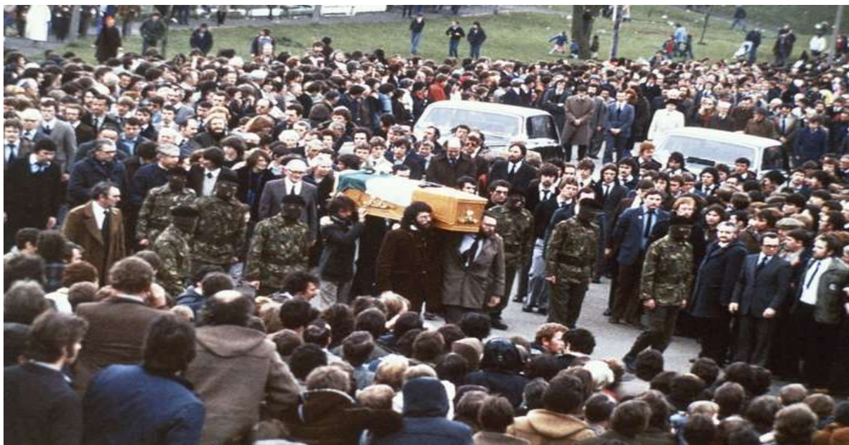
Gambar 3.19. Proses Pemakaman Seorang Anggota IRA di Belfast, Irlandia Utara

Organisasi ini memiliki pendapatan sebesar US$ 450 juta per tahun atau Rp.5,3 triliun (kurs: Rp.11.995 per dollar AS). Irish Republican Army (IRA) telah dijuluki salah satu organisasi pencucian uang profesional terkemuka di Eropa. Berasal dari kelompok pejuang revolusioner untuk kemerdekaan Irlandia dari Inggris, IRA berjuang sebagai pengontrol politik selama beberapa dekade. Mereka dianggap sebagai kelompok teroris karena pemboman yang tak terhitung jumlahnya dan pembunuhan dikaitkan dengan mereka selama pemberontakan melawan pemerintahan Inggris di Irlandia. Mereka sekarang memiliki banyak usaha kecil di seluruh Inggris dan diduga menggunakan keuntungan untuk sumber tindak kriminalnya. Pada tahun 2013, Irlandia Independent melaporkan bahwa IRA memiliki koneksi ke kelompok mafia di Italia yang mampu menyumbang 450 euro. Ini hanya salah satu link yang berhasil diketahui, diprediksi masih banyak sumber pendanaan yang berasal dari mafia di tempat lain. Hanya saja organisasi ini telah menyatakan diri dibubarkan pada tahun 2005 (Praditya, 2014).