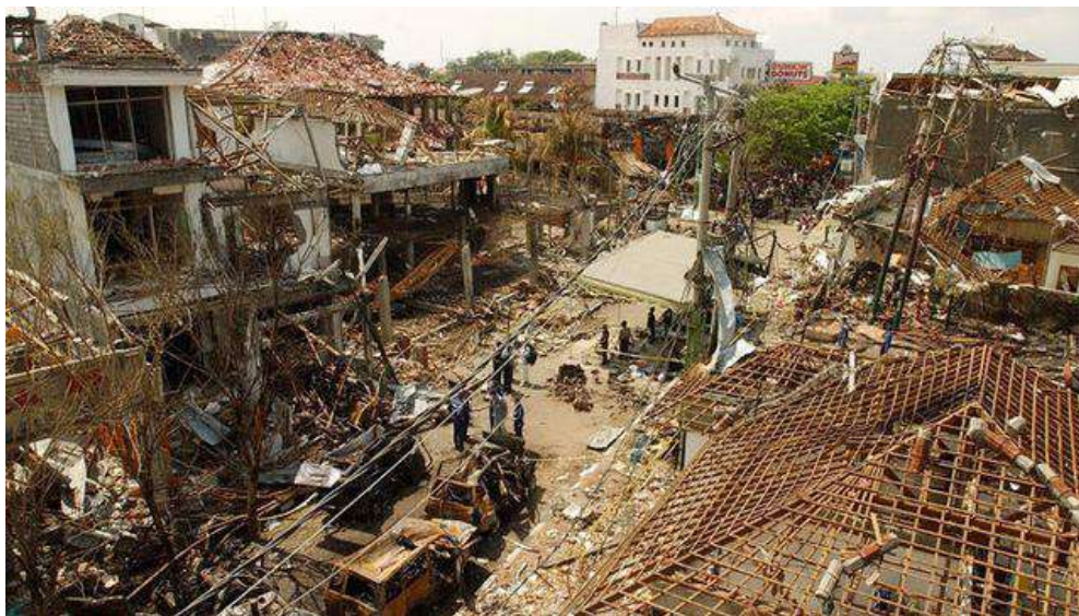
Gambar 2.9. Ledakan Bom Bali II

Teror bom bunuh diri kembali terjadi di Bali pada tanggal 1 Oktober 2005. Lokasi serangannya pun berada di pusat kawasan wisatawan asing, tepatnya di R.AJA's Bar and Restaurant Kuta, Menega Cafe dan Nyoman Cafe Jimbaran. Tragedi bom Bali II ini memakan korban tewas sebanyak 23 orang termasuk pelaku dan kebanyakan korban yang tewas adalah warga asing. Warga lokal yang menderita luka-luka sekitar 196 orang. Ledakan bom ini terdengar sampai di Pantai Kuta dan membuat kaca mobil Toyota Starlet yang berada di depan Toko Polo di seberang R.AJA's and Restaurant hancur. Banyaknya warga dan turis yang berencana menghadiri Oktober Festival di pantai di depan Hard Rock Café, Kuta langsung membubarkan diri setelah bom ini terjadi. Pelaku bom bunuh diri berjumlah tiga orang yaitu Muhammad Salik, Firdaus Misno, dan Ayib Hidayat. Mereka membawa bahan peledak sekitar 10 kilogram. Dua orang warga negara Malaysia Azahari Bin Husin dan Noordin Mohamed Top adalah tokoh penting dari aksi bom diri ini. Mantan Perdana Menteri Australia Tony Abbott berada di Bali pada saat kejadian. Abbott bersama istrinya Margie dan tiga putrinya sedang berlibur di Bali. Mereka sedang berada di hotel pada saat kejadian bom bunuh diri terjadi (Amani & Hardiyanto, 2019).