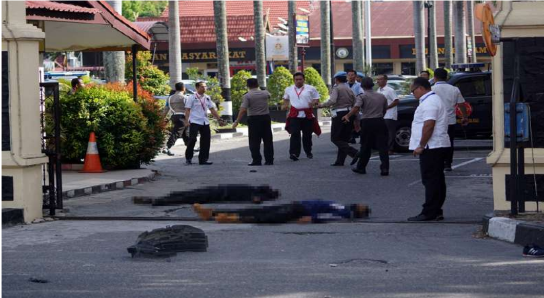
Gambar 2.21. Dua Pelaku Teror Terkapar di Pintu Gerbang Polda Riau

pengungkapan kasus narkoba. Tiba-tiba pelaku yang mengendarai mobil Avanza menabrak pagar Mapolda Riau. Saat bersamaan pelaku juga menabrak sejumlah anggota polisi yang sedang berjaga di pintu masuk. Dalam aksi tersebut polisi berhasil melumpuhkan pelaku dengan timah panas. Tercatat empat orang di antaranya kabur, sementara empat lainnya ditembak polisi (Novitra & Triyogo, 2018).