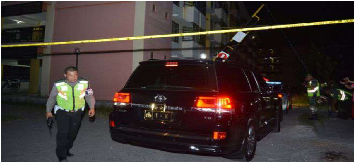
Gambar 2.22. Kendaraan Kapolda Jawa Timur Memasuki Lokasi Ledakan di Rusunawa