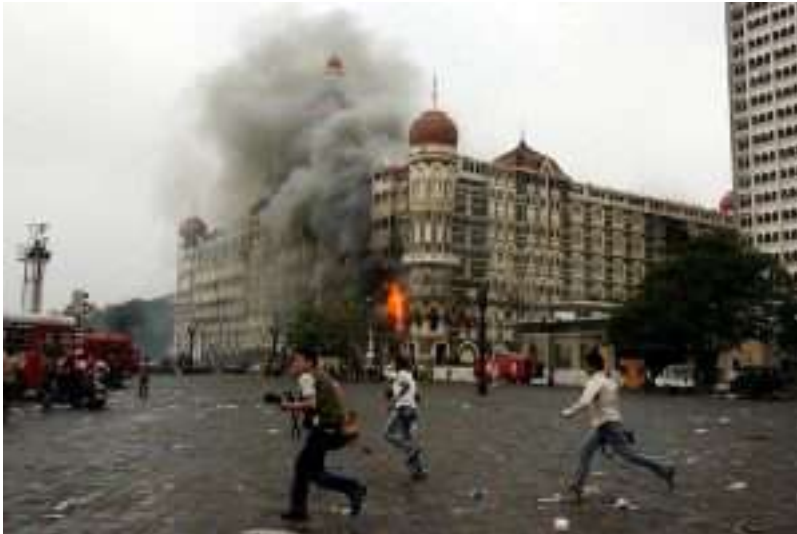
Gambar 3.6. Peristiwa Hotel Mumbai India tahun 2008

satu serangan yang dilakukan oleh LeT adalah serangan di Mumbai pada bulan November 2008 yang mengakibatkan 165 orang tewas (Muslim, 2017).