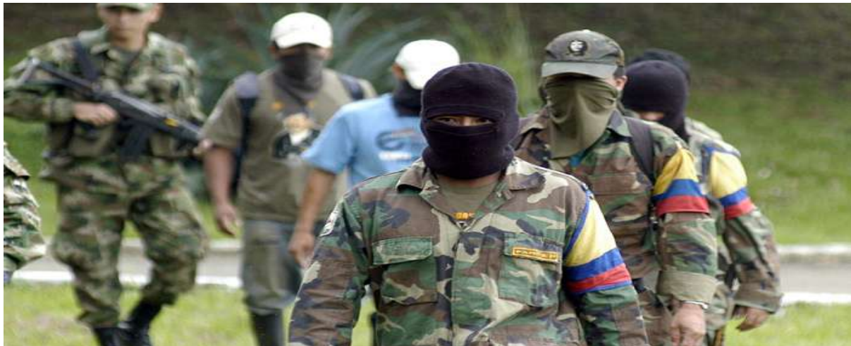
Gambar 3.11. Gerilyawan FARC

melakukan silent war pada tahun 1999 dengan menculik para tentara dan membunuh mereka secara diam-diam (Nugroho, 2016).