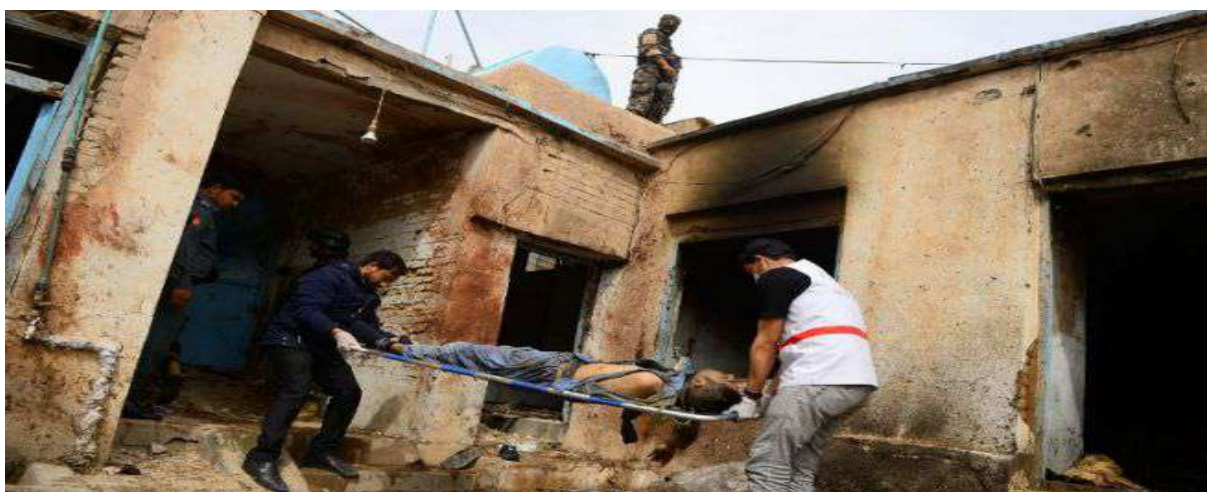
Gambar 3.16. Korban Serangan Taliban di Afghanistan pada tanggal 29 Mei 2019

Organisasi ini memiliki pendapatan sebesar US$ 400 juta per tahun atau Rp.4,3 triliun (kurs: Rp.11.995 per dollar AS). Kelompok teroris asal Afghanistan ini terkenal dengan pendapatannya yang fantastis sebanyak US$ 400 juta setiap tahunnya. Uang tersebut didapatkannya dari hasil perdagangan narkoba, perdagangan manusia, pemerasan, serta beberapa dari sumbangan organisasi lainnya. Taliban kini menjadi penanggung jawab produksi opium terbesar di Afghanistan yang menyumbang paling banyak pendapatan mereka (Praditya, 2014).