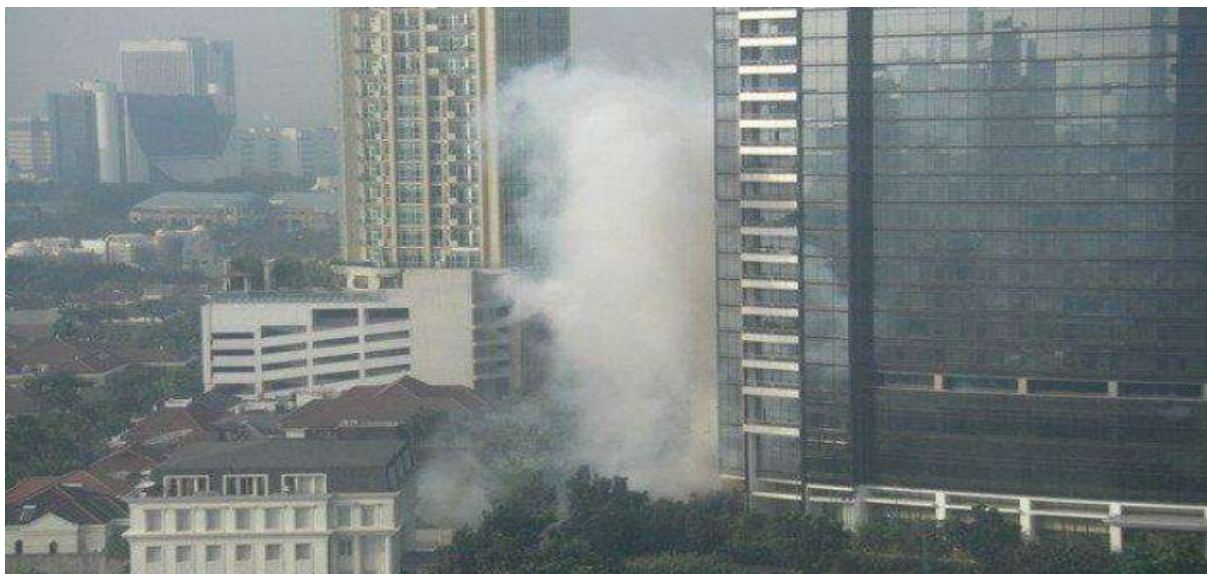
Gambar 2.10. Peledakan Bom JW Marriot & Ritz-Carlton

yang akan melakukan promo tour ke Indonesia. Dalam rangka kedatangan klub sepak bola tersebut, PT.Nike Indonesia sudah menyewa Istora Senayan untuk kegiatan kompetisi sepak bola dalam ruangan Nike 5 Challenge terpaksa dibatalkan. Selain itu, 131 tim yang telah mendaftar dengan undangan 8.000 orang untuk kegiatan tersebut dan acara nonton bareng latihan pemain MU dan pertandingan melawan Indonesia All Star juga ikut dibatalkan. Kegiatan lain yang kena dampak dari pengeboman ini adalah kegiatan dan kuis yang sudah dirancang Kompas MuDA yang rencananya akan menggelar dua kuis yaitu kerja bareng Nike 5 Challenge dengan nonton streetball bareng MU1 pada tanggal 19 Juli dan kuis tiket VIP nonton MU vs Indonesia All Star pada tanggal 20 Juli juga dibatalkan. Kompetisi artikel dan foto tentang MU yang diselenggarakan oleh Kompas MuDA terpaksa dibatalkan. Operator selular 3 yang telah mengeluarkan anggaran untuk kegiatan promosi besar-besaran dalam rangka mendatangkan MU ke Indonesia mengalami kerugian yang besar (Republika, 2012).