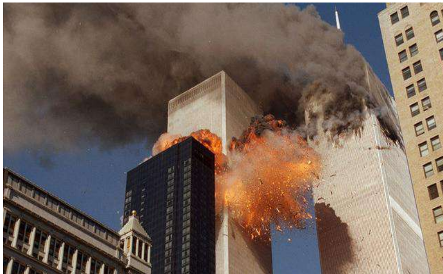
Gambar 1.1. Serangan Teroris di World Trade Centre, New York pada 9 September 2001

Pernyataan Kofi Annan diatas menegaskan bahwa terorisme adalah suatu ancaman global yang akan menimbulkan efek secara global juga. Setelah terjadinya serangan teroris pada tanggal 11 September 2001 di New York, Pennsylvania, dan Washington D.C., Dewan Keamanan PBB dengan suara bulat mengadopsi resolusi 1368 tahun 2001 yang menegaskan seruan kepada semua negara untuk bekerjasama dalam menghadapi serangan teroris (Security Council, 2001). Resolusi tersebut juga menegaskan prinsip dan tujuan Piagam PBB untuk memerangi tindakan-tindakan teroris karena mengancam perdamaian dan keamanan internasional.