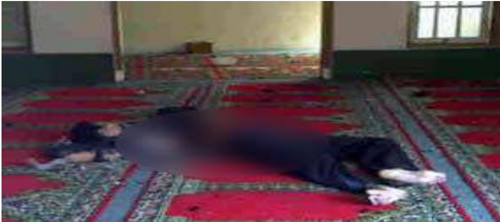
Gambar 2.11. Pelaku Bom Bunuh Diri di Masjid Polresta Cirebon