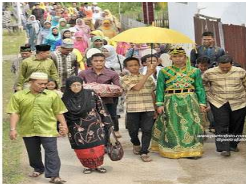
Gambar 5.13. Mappenre Botting

Mappenre botting (mengantar pengantin), adalah mengantar mempelai pria ke rumah mempelai wanita untuk melaksanakan beberapa serangkaian kegiatan seperti madduppa botting , akad nikah, dan mappasiluka . Mempelai pria diantar oleh iring-iringan tanpa kehadiran kedua orang tuanya. Adapun orang-orang yang ikut dalam iring-iringan tersebut di antaranya indo' botting (perias pengantin), dua orang passeppi (pendamping mempelai) yang terdiri dari anak laki-laki, beberapa kerabat atau orang-orang tua sebagai saksi pada acara akad nikah, pembawa mas kawin, dan pembawa hadiah-hadiah lainnya.