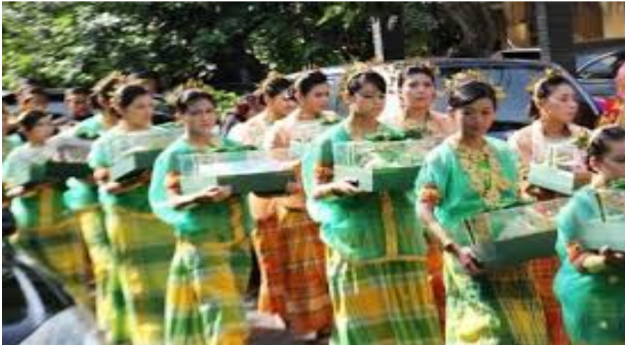
Gambar 5.4. Prosesi Madduta

Dikenal juga istilah mappasiarekeng (mengukuhkan kesepakatan), berarti mengukuhkan kembali kesepakatan-kesepakatan yang telah dibuat sebelumnya. Acara ini dilaksanakan di tempat mempelai perempuan. Pengukuhan kesepakatan ditandai dengan pemberian hadiah pertunangan dari pihak mempelai pria kepada pihak mempelai wanita sebagai passio' atau pengikat berupa sebuah cincin emas dan sejumlah pemberian simbolis lainnya seperti tebu sebagai simbol kebahagiaan, panasa (buah nangka) sebagai simbol minasa (pengharapan), sirih pinang, sokko (nasi ketan), dan berbagai kue-kue tradisional lainnya.