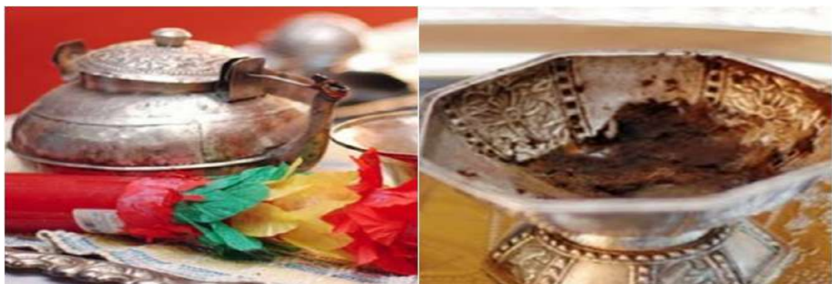
Gambar 5.11. Daun Pacar yang Telah di Hancurkan

Selanjutnya mappacci atau tudampenni (mensucikan diri), dilaksanakan pada malam menjelang hari “H” perkawinan. Kedua mempelai melakukan kegiatan mappacci atau tudampenni di rumah masing-masing. Acara ini dihadiri oleh kerabat, orang-orang terhormat, dan para tetangga. Kata mappacci berasal dari kata pacci , yaitu daun pacar ( lawsania alba ).