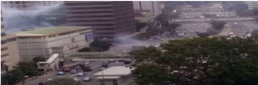
Gambar 2.12. Ledakan di Sekitar Gedung Sarinah, Jalan MH Thamrin Jakarta Pusat

Ledakan terjadi di Kafe Starbucks, Gedung Skyline Jakarta Pusat pada tanggal 14 Januari 2016. Selang lima menit dari ledakan pertama, seorang pelaku teror meledakkan tas berisi bom dalam kemasan gas elpiji melon 3 kilogram ke dalam Pos Polisi. Dua pelaku yang membaur ditengah keramaian menembaki warga secara acak dengan senjata api rakitan yang sudah berkarat pada pukul 10.52. Satu polisi ditembak di punggung dari jarak dekat dan satu pekerja Bangkok Bank ditembak dibagian kepala. Kemudian, ledakan ketiga terjadi pada pukul 10.56 WIB di tengah Jalan Thamrin, depan Gedung Skyline. Suara ledakan itu berasal dari granat rakitan pelaku teror. Setelah itu, terdengar suara ledakan keempat pukul 10.59 WIB di lokasi yang sama. Ledakan tersebut berasal dari granat rakitan. Kemudian, dua teroris meledakkan satu bom pipa besi dan granat rakitan pada pukul 11.05 WIB di halaman parker Starbucks dan Burger King. Bukti-bukti yang ditemukan di TKP oleh pihak kepolisian seperti dua buah serpihan accu 12 volt merek GS warna hitam, dua buah saklar tipe geser warna putih, 22 butir peluru berukuran 22 milimeter, lebih dari 446 buah sekrup diameter 1 sentimeter, dan lebih