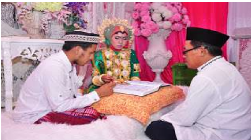
Gambar 5.9. Mappanre Temme

Kemudian acara mappanre temme (khatam AlQuran) dan pembacaan barazanji, dilaksanakan sebelum memasuki acara mappaci . Diawali dengan dilakukan acara khatam AlQur'an dan pembacaan barazanji sebagai ungkapan rasa syukur kepada Allah SWT dan sanjungan kepada Nabi Muhammad SAW. Acara ini dilaksanakan pada sore hari atau sesudah shalat ashar dan dipimpin oleh seorang imam. Setelah itu, dilanjutkan acara makan bersama dan sebelum pulang, para pembaca barazanji dihadiahi kaddo yaitu nasi ketan berwarna kuning yang dibungkus dengan daun pisang sebagai oleh-oleh untuk keluarga di rumah.