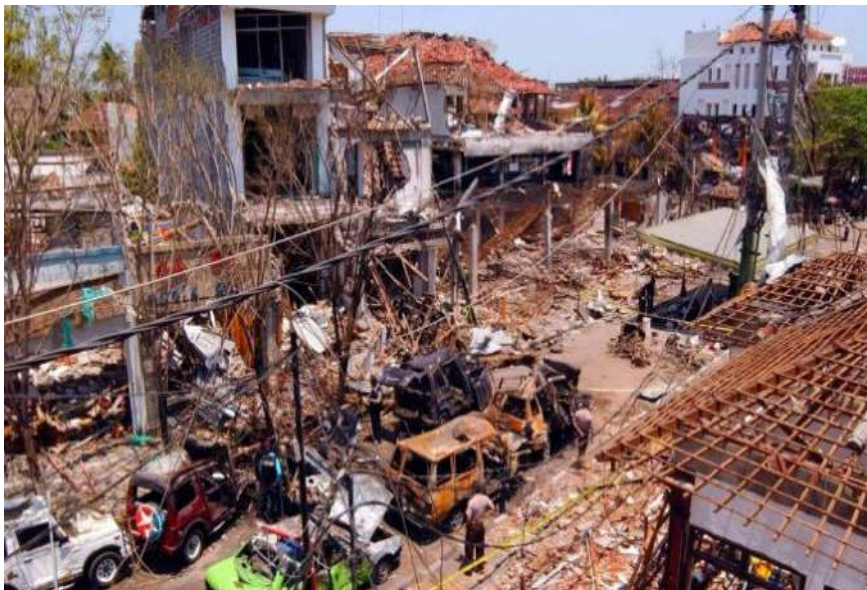
Gambar 2.1. Bom Bali 2002 (Apsari, 2018)

Rentetan bom tersebut terjadi pada tanggal 12 Oktober 2002 sekitar pukul 23.15 WIB. Ledakan pertama dan kedua terjadi lima meter di depan Diskotek Sari Club, di Jalan Legian, Kuta. Sesaat setelah ledakan pertama, sebuah bom kembali meledak di Diskotek Paddy's yang terletak di seberang Sari Club di Jalan Legian, Kuta. Sesaat setelah ledakan pertama, sebuah bom kembali meledak di Diskotek Paddy's yang terletak di seberang Sari Club. Akibat dari ledakan beruntun ini, baik Sari Club, Diskotek Paddy's dan bangunan Panin Bank yang terletak persis di depan Sari Club terbakar. Selain itu, puluhan bangunan yang berada di radius 10 hingga 20-an meter dari lokasi rusak berat. Adapun kaca-kaca hotel, toko maupun tempat hiburan lainnya tak luput dari kerusakan. Kuatnya ledakan juga membuat kantor biro perjalanan yang berada di samping Sari Club rata dengan tanah. Kemudian sesaat setelah itu, ledakan ketiga terjadi sekitar 100 meter dari Kantor Konsulat Amerika Serikat di daerah Renon, Denpasar, Bali. Kuatnya ledakan di ketiga tempat tersebut menyisakan lubang selebar 4 - 4,5 meter dengan kedalaman 80 sentimeter (Haryanti & Sartika, 2019).