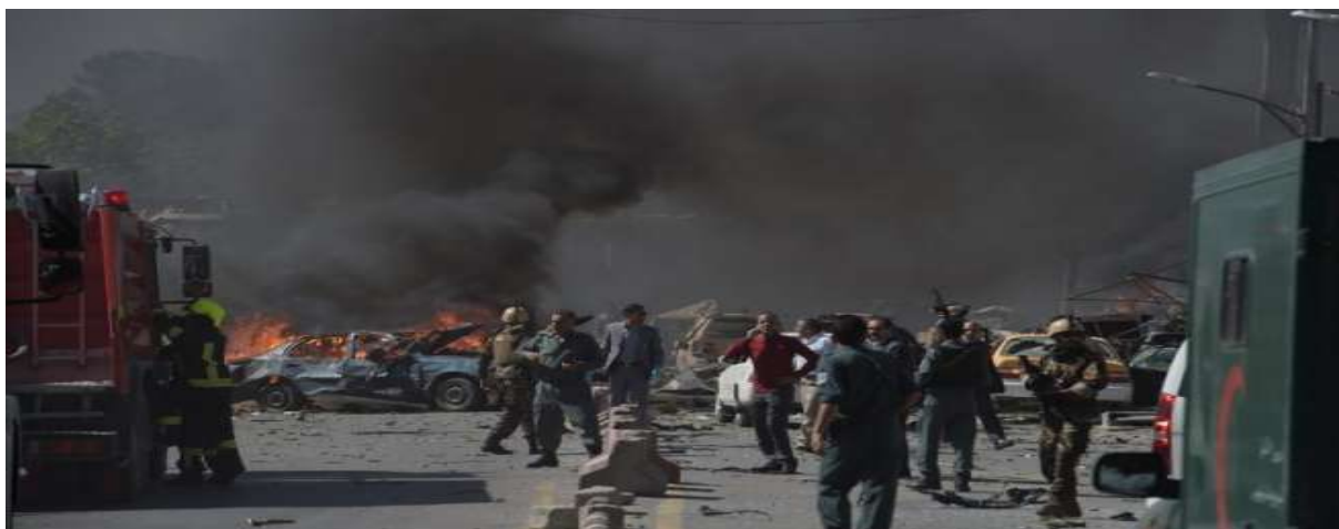
Gambar 3.18. Serangan Taliban di Bagian Utara Afghanistan

Milisi Taliban menyerang bagian Utara Afghanistan di daerah Khwaja Pak dan Taloka di pinggir kota Kunduz pada tanggal 5 Februari 2019 yang menyebabkan 36 Anggota pasukan keamanan Afghanistan dan 22 gerilyawan Taliban tewas (Santoso, 2019). Pertempuran ini terjadi bersamaan dengan babak pembicaraan perdamaian yang sedang berlangsung di Moskow antara wakil Taliban dan beberapa pejabat Afghanistan.