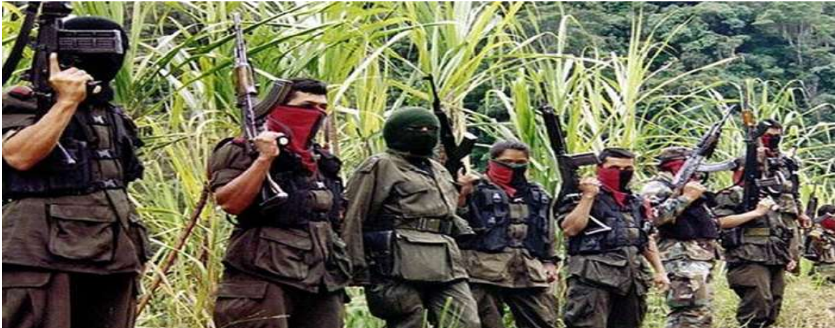
Gambar 3.7. Gerilyawan FARC Sumber: (Nugroho, 2016)

Kelompok FARC pada awalnya adalah pihak oposisi dari pemerintah Kolombia saat terjadi perang sipil. Kelompok ini dibiarkan pada saat perdamaian terjadi untuk membuat negara sendiri dengan Republik Marquetalia. Pada akhirnya, pemerintah melarang pendirian negara tersebut yang menyebabkan anggota kelompok ini mengamuk. Kemudian, kelompok ini mengubah nama menjadi FARC dengan beranggotakan 50 orang. Akibat kekerasan, siksaan, dan trauma yang didapatkan dari pemerintah Kolombia menjadikan kelompok tersebut berubah menjadi kelompok teroris yang kejam dan membunuh rakyat Kolombia tanpa rasa perikemanusiaan (Nugroho, 2016).