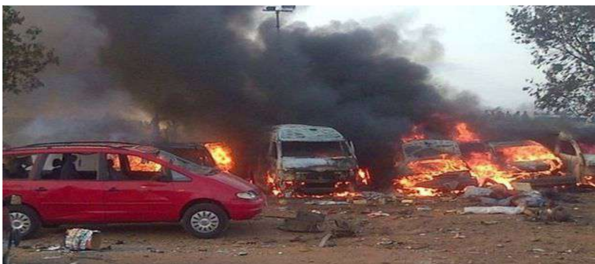
Gambar 3.3. Penyerangan yang Dilakukan Boko Haram

Nama resmi Boko Haram adalah Jama'atu Ahlis Sunna Lidda'awati wal'Jihad yang berarti orang yang taat pada ajaran Da'wah dan Jihad Nabi Muhammad SAW.