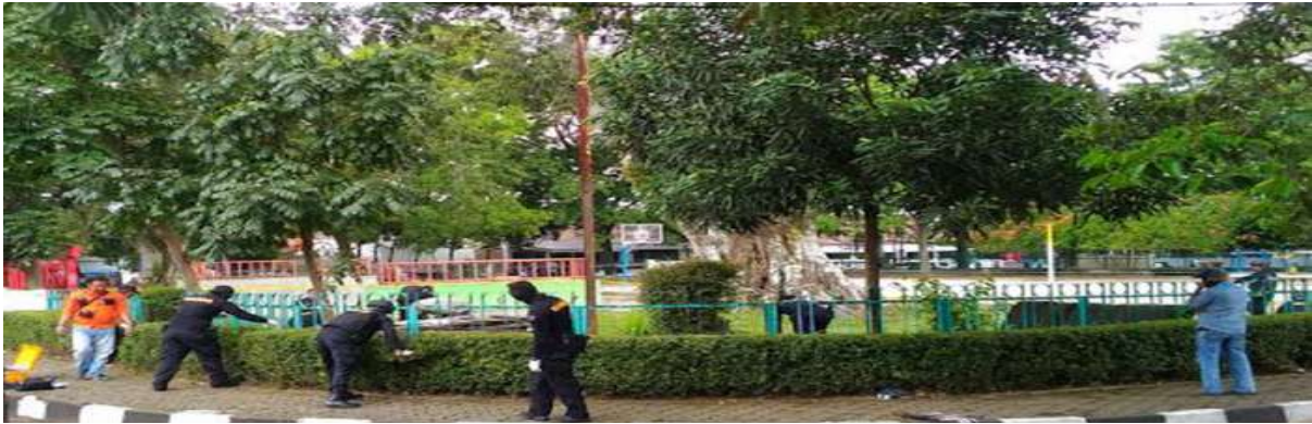
Gambar 2.15. Ledakan Bom Panci di Taman Pandawa, Kota Bandung