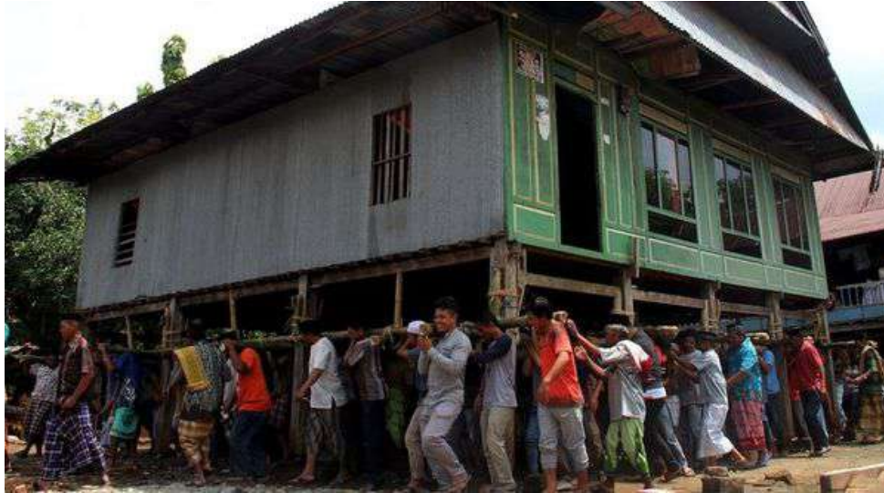
Gambar 5.2. Kegiatan Mappatettong Bola

salah satu kabupaten yang dominan memiliki jumlah suku Bugis. Kerajaan Sidenreng adalah salah satu kerajaan yang cukup disegani. Kerajaan tersebut tercantum dalam kitab “La Galigo”. Mappatettong bola menjadi kebiasaan yang selanjutnya menjadi budaya sejak jaman kerajaan sampai sekarang yang terus dilestarikan.