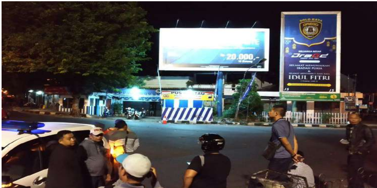
Gambar 2.25. Ledakan Bom di Pos Polisi Tugu Kartasura, Sukoharjo, Jawa Tengah