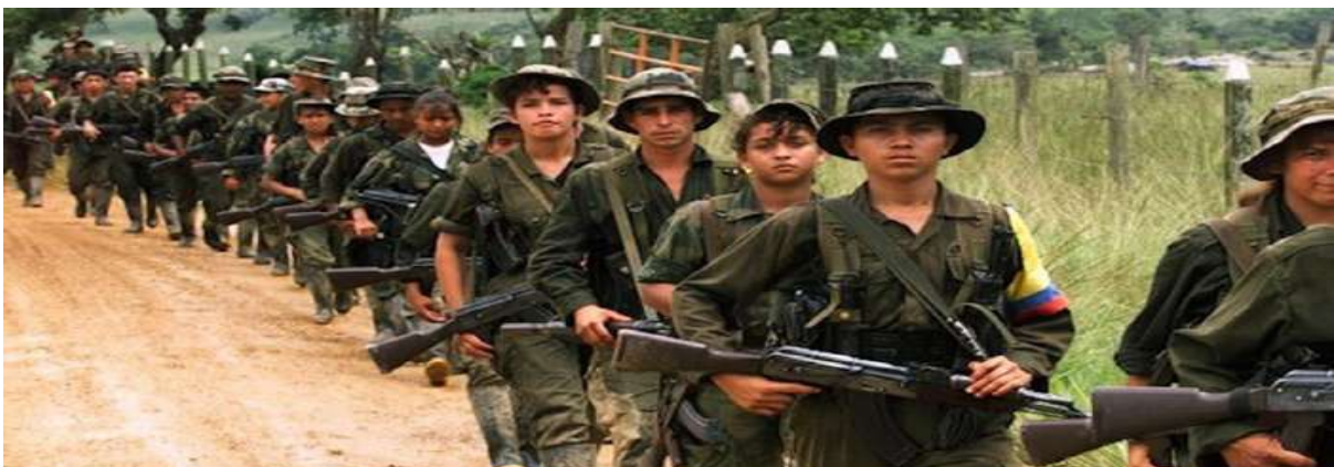
Gambar 3.10. Tentara Anak FARC

Selain merekrut orang dewasa, FARC juga merekrut anak-anak terutama keluarga menengah ke bawah untuk dijadikan tentara. Kelompok ini mempromosikan kehidupan yang lebih layak dan masa depan yang terjamin bila bergabung dengan kelompok mereka. Anak-anak yang berumur 12 tahun keatas baik laki-laki atau perempuan akan lebih diutamakan dalam proses perekrutan. Anak-anak laki-laki yang berumur 12 sampai 15 tahun akan dilatih setiap hari dalam menggunakan persenjataan. Sementara anak perempuan akan dilatih bagaimana melayani anggota FARC. Setelah berumur 15 tahun, anak-anak tersebut akan diajak ke medan pertempuran (Nugroho, 2016).