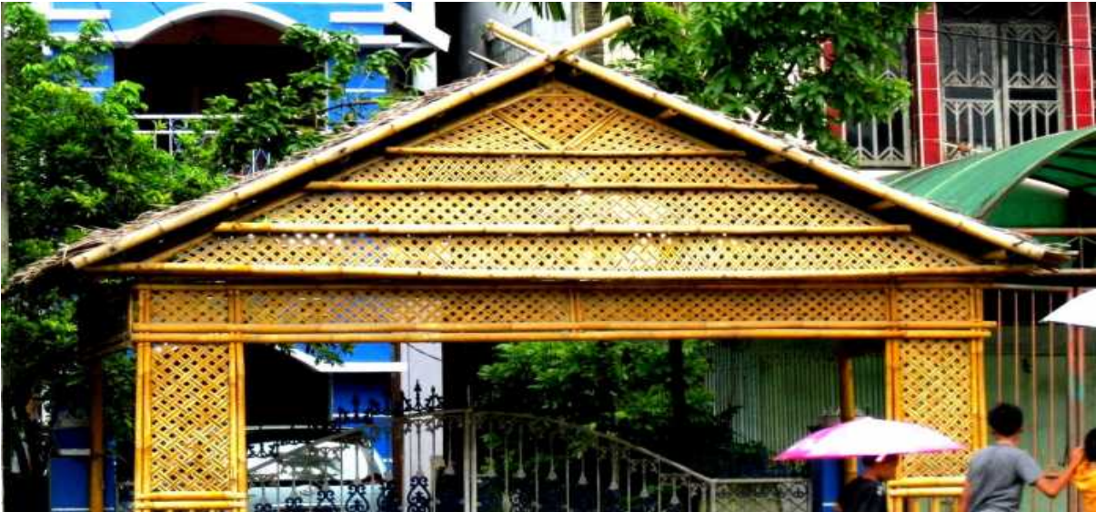
Gambar 5.6. Wolasuji

Tahap berikutnya adalah mappassau botting dan cemme passili (merawat dan memandikan pengantin). Mappassau botting berarti merawat pengantin. Kegiatan ini dilakukan dalam satu ruangan tertentu selama tiga hari berturut-turut sebelum hari “H” perkawinan. Perawatan ini dilakukan dengan menggunakan berbagai ramuan seperti daun sukun, daun coppeng (sejenis anggur), daun pandan, rempah-rempah, dan akar-akaran yang berbau harum.