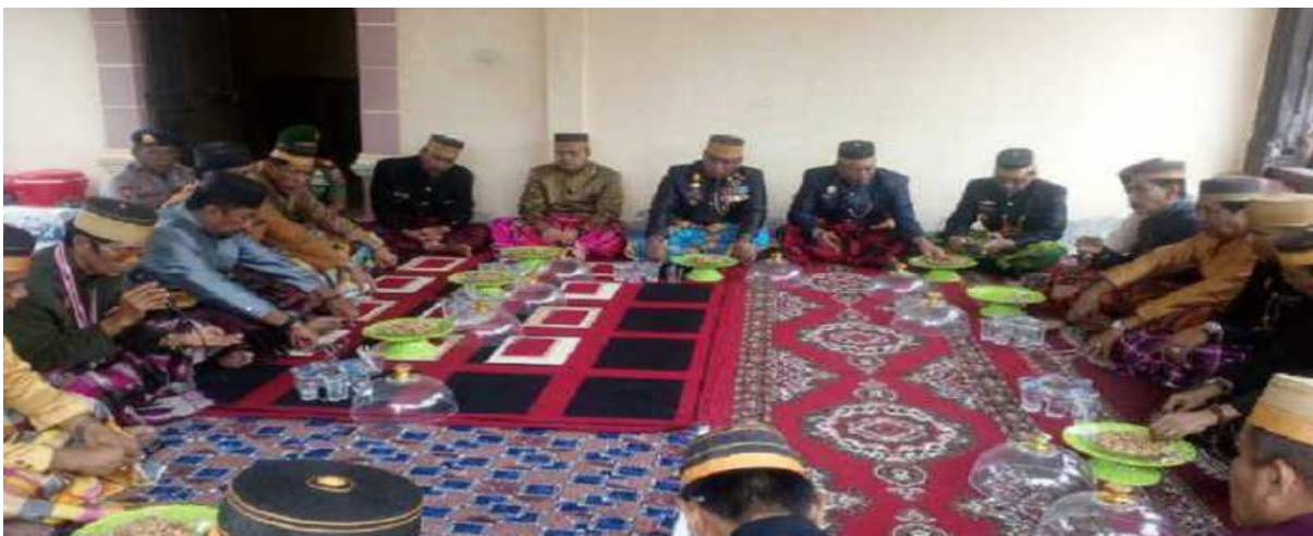
Gambar 5.16. Acara Tudang Sipulung di Kabupaten Bone, Provinsi Sulawesi Selatan

Pelaksanaan upacara tudang sipulung sebagai suatu kearifan lokal di suku Bugis telah berlangsung lama. Apabila terjadi permasalahan di sektor pertanian, misalnya permasalahan dalam hal cocok tanam atau panen, tudang sipulung akan diadakan oleh tokoh masyarakat atau tokoh adat dengan mengundang orang-orang yang tahu dalam melihat perbintangan. Pada akhirnya akan ada kata sepakat diantara mereka yang hadir dalam acara tudang sipulung tersebut. Kesepakatan ini akan bersifat mengikat untuk peserta yang hadir sehingga sebaiknya harus ditaati untuk kepentingan bersama.