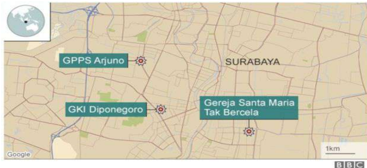
Gambar 2.19. Lokasi Kejadian di Tiga Gereja